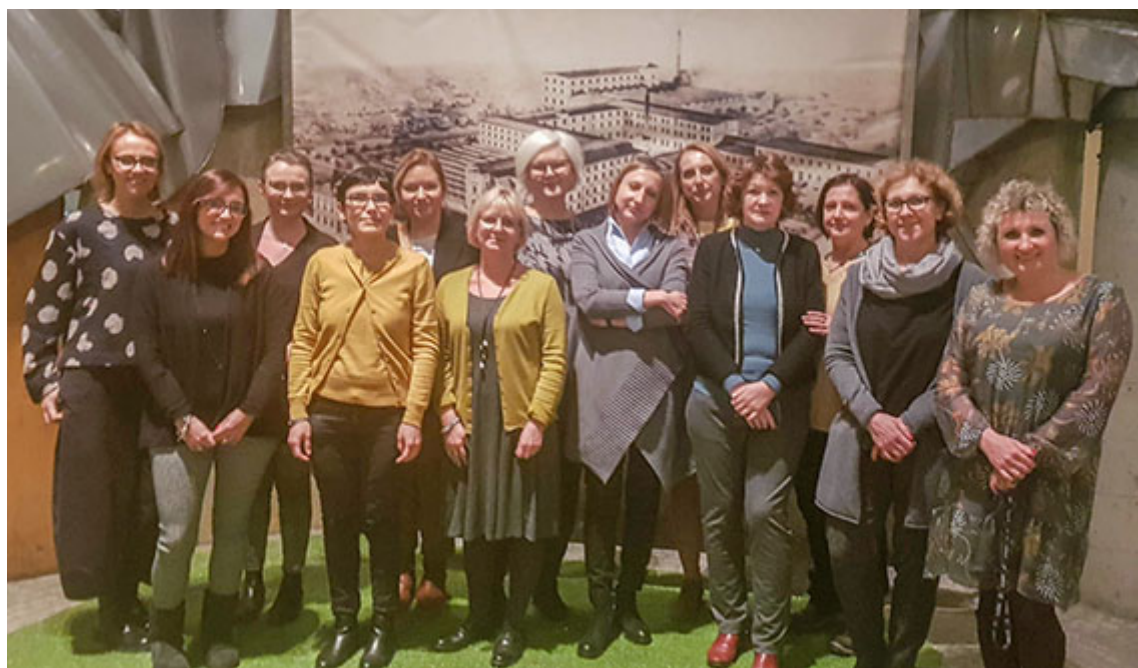
Sammanlagt fem länder är med i ALONE-projektet; Sverige, Italien, Rumänien, Polen och Litauen.

Uppdaterad: 2020-02-05 av Fabian Rimfors